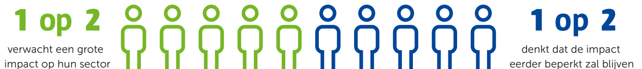
Figuur 2. Digitaliseringsperceptie bij Belgische industriële kmo's